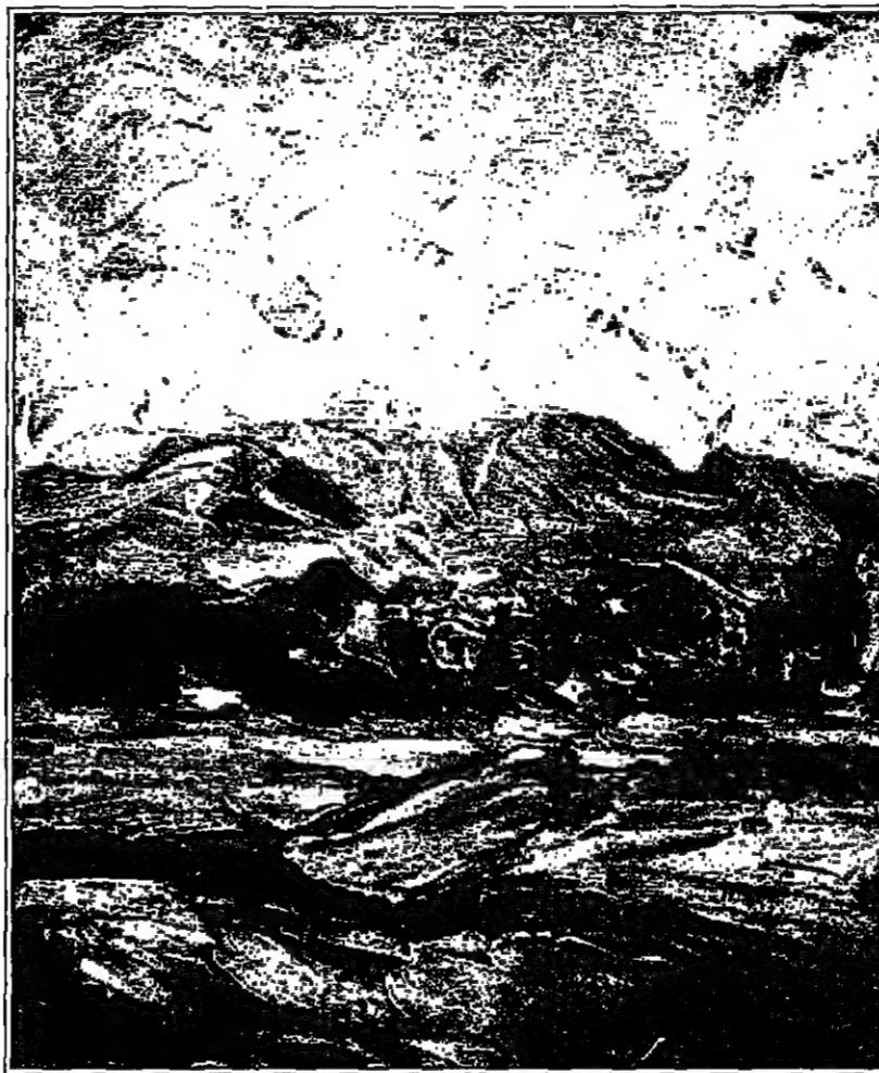
من اعمال الفنان

عبد الرحمن منيف مروان قصاب باشي رحلة الحياة والفن